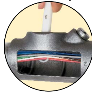
Gancho, ferramenta #3 eleve facilmente todos os condutores.

O Cooper Crouse-Hinds EYS Tool Kit permite com segurança e confiabilidade a colocação da fibra de em unidades seladoras. Constituído por cinco ferramentas em um estojo de mão o EYS Tool Kit torna rápida e fácil o crítico processo de separação dos condutores e acomodação da fibra de vedação.